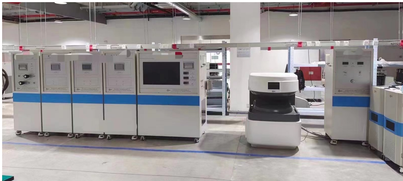
图 2 高压在线荷载核磁共振分析与成像系统

综上，西华大学彭州校区第 5 教学楼 5-103 实验室 ( 6.64 \times 6.64\text{m} ) 完全满足本项目实施的空间需求。